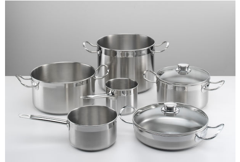
Induction Pro 锅具套装 8件 8210 008